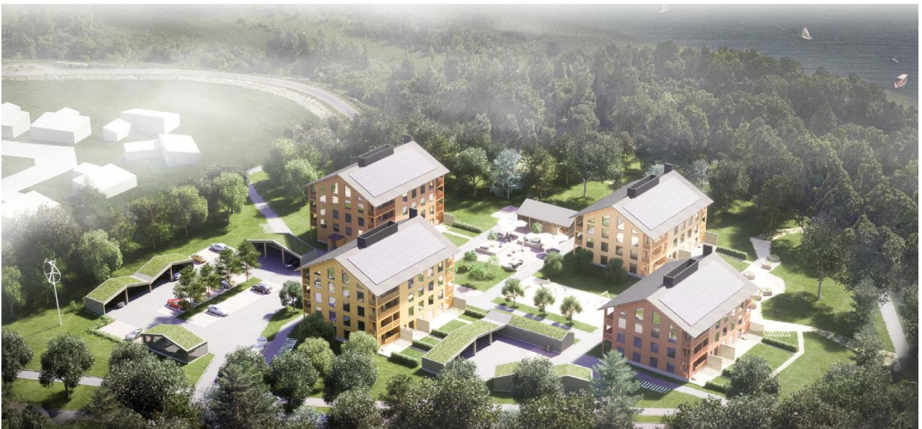
Kilpailuehdotus "Pihakvartetti", VRP Etelä-Suomi Oy.

Stålhanentien ja Vanhankyläntien kulmassa sijaitseva Väärämäen metsikkö säilytetään luonnontilaisena lähivirkistysalueena. Asuinpihojen istutuksissa tulee käyttää alueelle soveltuvaa kasvivalikoimaa, jotta kasvikarkulaiset eivät leviä arvokkaille alueille.