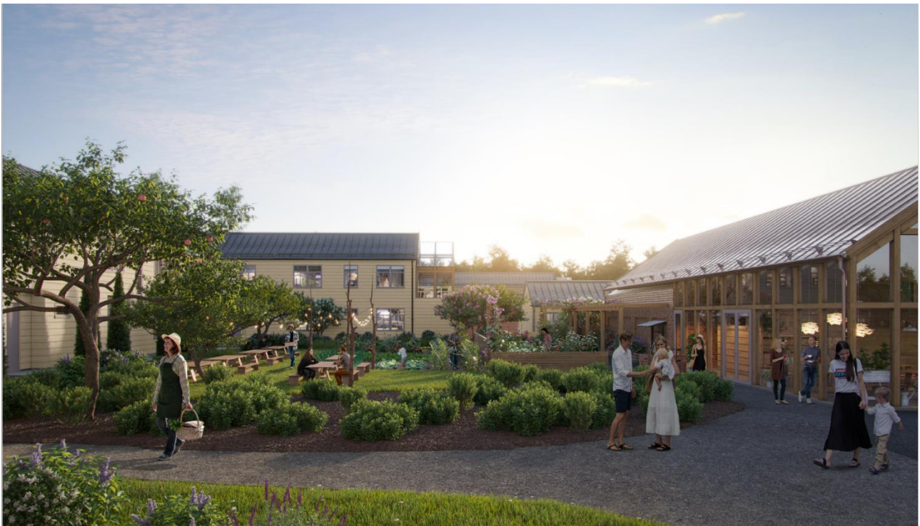
Kilpailuehdotus "Vanhiksen Lyhdyt", Suomen Hyvä Koti Oy.